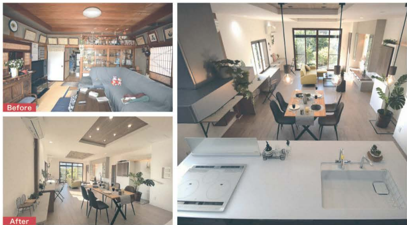
■居間として使用していた和室とDKを一体化して、家族の会話が弾む開放的なLDKに

今と未来をつなぐリフォーム、リノベーションを提案 1921(大正10)年創業の大進建設。「時の流れとともにつつと幸せに暮らしていつてほしい」という思いを込めて、リフォーム&リノベーションのブランド「つぐのあ」を立ち上げた。つぐ(次・継)繋(幸)と、あ(時間・空間)のあ(幸せ)という二つの意味を合わせた造語だ。同社はきれいな空気環境や、自然素材を使った新築物件も数多く手がける。新築のブランド「ときのあ」は、「心から健康やかに暮らす住まい」毎日楽しく過ごす。 時間と空間を大切に考えた住まい。「ずっと幸せに暮らしてほしい」との願いが込められており、その思いはリフォーム&リノベーションの住まい「つぐのあ」にもつながっている。 年齢や家族構成、環境は時がたつほど大きく変わる。同時に生活の仕方や欲しいと思う空間、必要な設備なども変わっていく。 「今」と「未来」をつなぐリフォーム&リノベーションを、豊富な実績と技術で提案する。