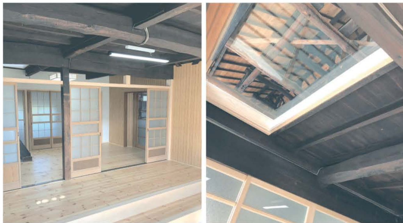
築100年以上の古民家リノベーション。古材を活かしつつ、光が降り注ぐ明るい玄関に生まれ変わった