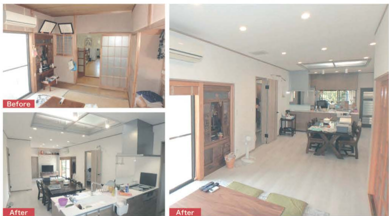
■中廊下で分断された居間と食堂・台所を、梁を入れ替え柱と間仕切戸を取り除き、広くて使い勝手の良いスタイリッシュなLDKを実現