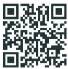
「よくある相談事例」