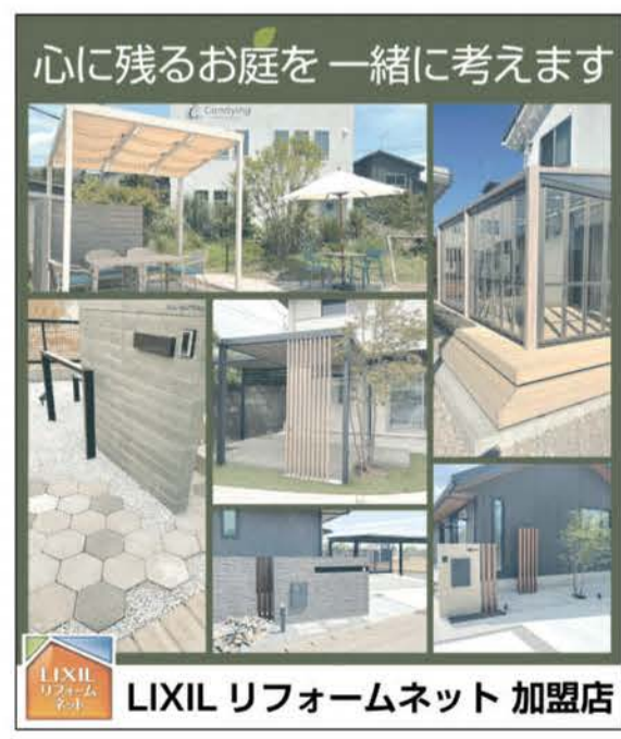
LIXIL リフォームネット 加盟店

洗練されたデザインの注文住宅を得意とするサウス・バイ・イースト。9月末、新社屋兼ショールームを高崎市菅谷町にオープンし、新築やリフォーム、庭づくりに関する相談に真摯に対応していく。大手ハウスメーカーの施工店として蓄積したノウハウや技術は、リフォーム・リノベーションに生かされている。どのメーカーで建てた住宅でも水回りなどの交換から中古住宅大規模改修まで請け負える。 エクステリア事業部「エルクラフト」と協力し、住宅と自然が共生する庭づくりにも取り組む。リビングと庭をつなぐ広いデッキスペースを設けることで、四季を感じながらお茶や食事を楽しめる。家にながらリゾート気分が満喫できると人気だ。 住む人の暮らしやすさと快適さを考慮した設計は同社の女性プランナーを中心にデザイン。「小さな不具合から大きな不便までご相談ください」と呼び掛ける。