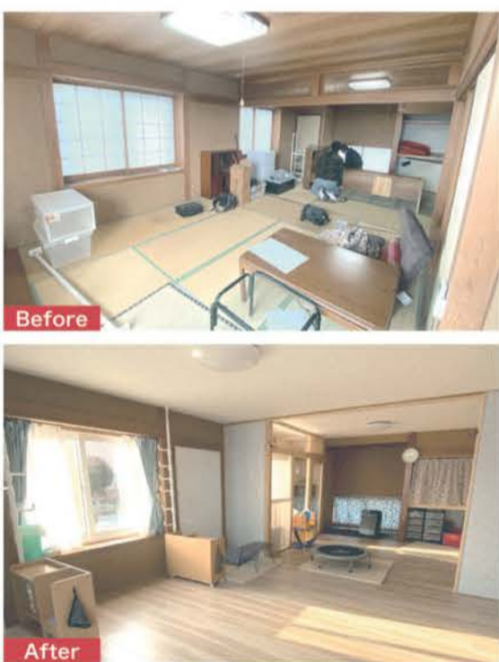
■二間続きの和室を子どものプレイルームとペット部屋へ。家族構成の変化に合わせて住まいにも変化を

12月31日までに工事完了するものが対象のため、この時期がラストスパート。予算が上限に達すると終了してしまうこともあるため、恩恵を受けるには、早めに決定し着工したい。