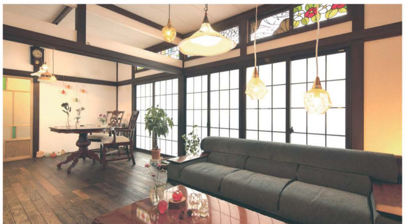
■リノベーションハウス「いえまもり」。昭和レトロの空間は、白漆喰の壁とステンドグラスによりやわらかな光の生活を演出