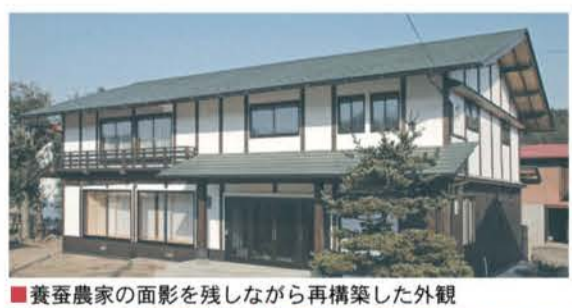
■養蚕農家の面影を残しながら再構築した外観