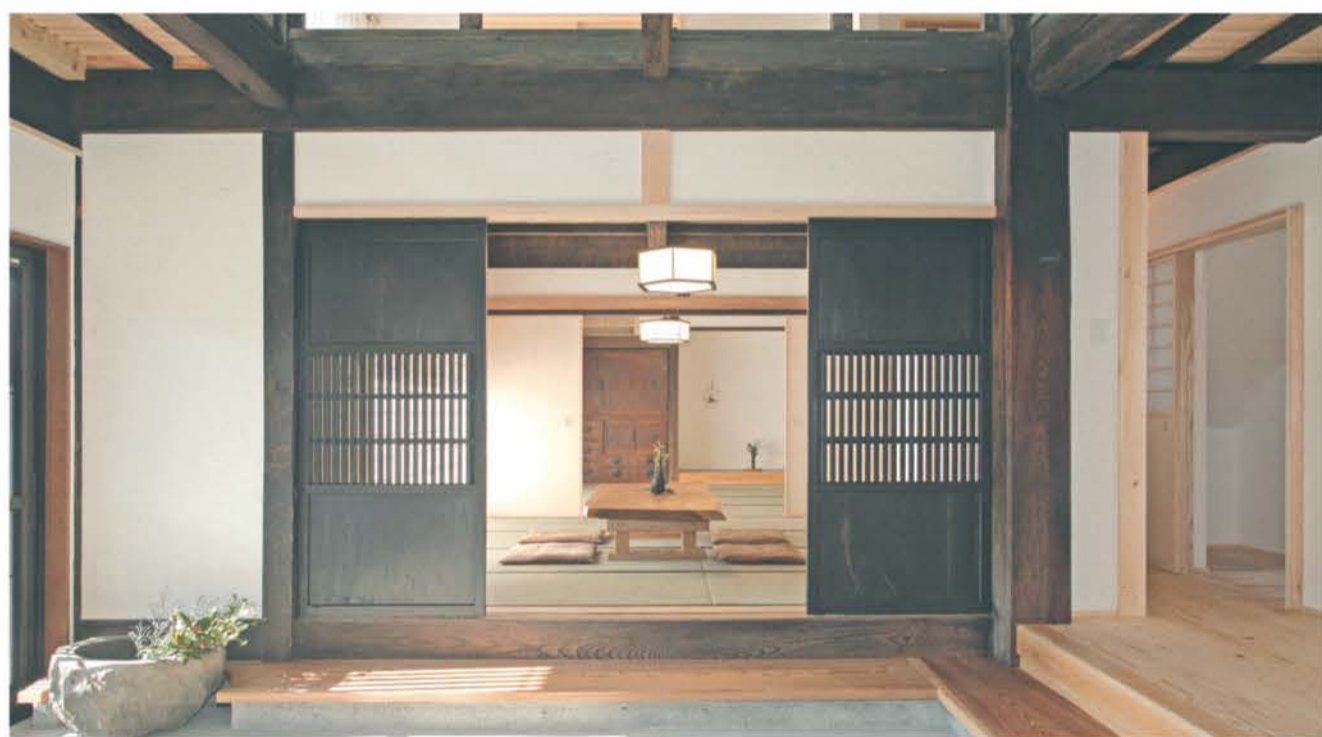
■築150年の家を現代に住み継ぐ新旧が調和する古民家再生

太陽光発電したエネルギーを床に蓄熱させて床暖冷房 当社の蓄熱床暖冷房は、一の暖房で多くのお客様より支持を得ている。この床暖房設備に床冷房機能を加える事で1年を通して使用する事が可能になった。高効率のヒートポンプ熱源はエネルギー消費効率が40%以上有る。これは1つのエネルギーを投入すれば4のエネルギーが得られる事を表す。石油やガスのボイラーが0.9程度なので約4.4倍の効率になる。 「プロフェッショナル本物の床暖房床冷房は、ヒーティングサービスの登録商標。」