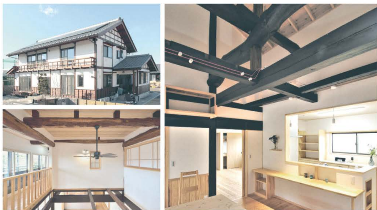
■区画整理に伴う解体移築。傷んだ土台や柱などは新しい無垢材に交換。断熱改修により断熱等級5相当を実現した。太陽光発電システムを搭載