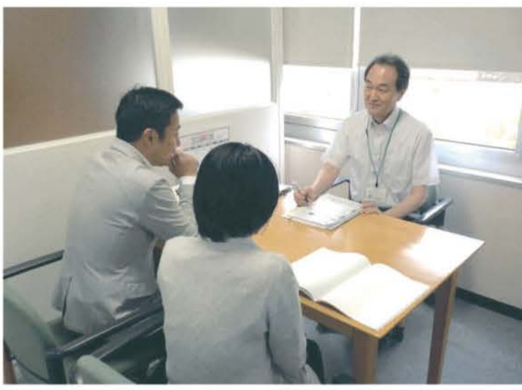
住宅に関する相談を受ける「ぐんま住まいの相談センター」のスタッフ