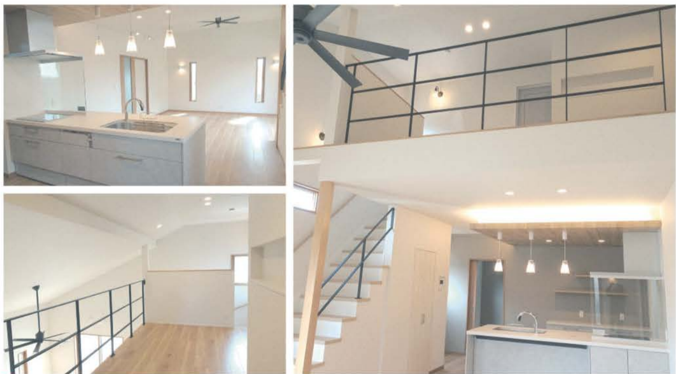
カーテンのない大開口サッシから光が差し込みリゾート感覚のLDK。ZEH仕様でソーラーパネルを取り入れた省エネ住宅

点を踏まえて実行に移すことがポイント。国などが支援制度や役立つサービスなどを用意しており、それらも活用して、失敗しない「リフォーム」を目指そう。