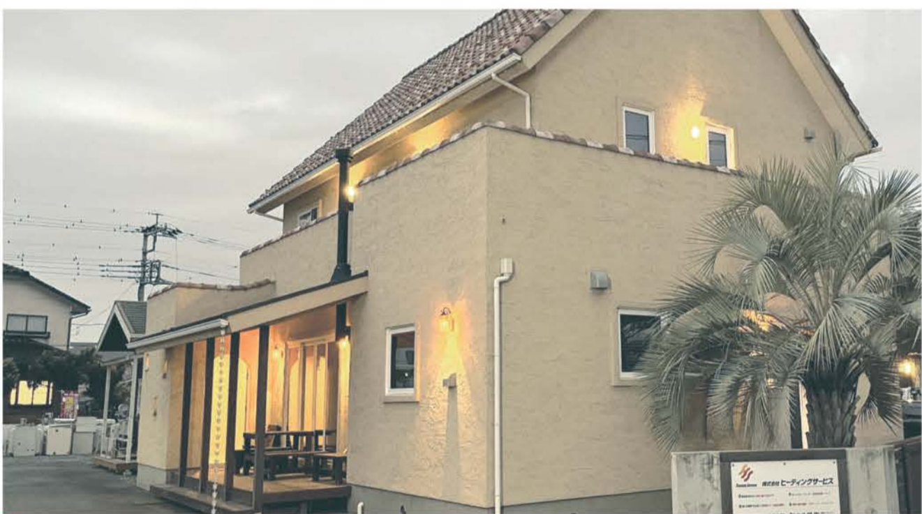
■当社モデルハウスは冬は床暖房、夏は床冷房が体感できる