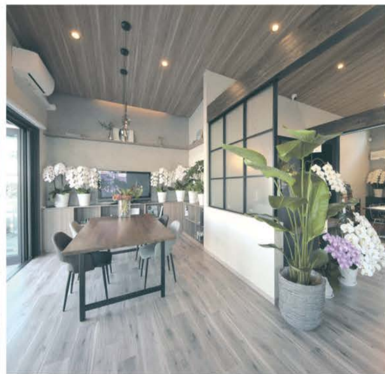
■高崎市菅谷町にオープンした新社屋兼ショールーム。快適な住まいと庭づくりを提案する