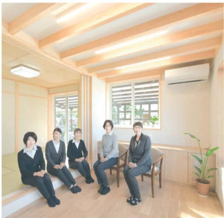
■左上:キッチンリフォーム例 左下:浴室リフォーム例 右:「高断熱リフォームを体験」できるモデルルームと女性スタッフ