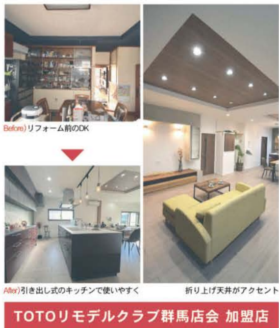
TOTOリモデルクラブ群馬店会 加盟店

キッチンと和室が開放的なLDKに 実績、デザインに評価 築40年の戸建て住宅に暮らすご夫妻。実績豊富な武井建設にキッチンのリフォームを依頼した。 居間として使っていた和室とキッチンとの収納を撤去して、開放的なLDKを実現。全体を見渡せる位置に 아일랜드キッチンを設置し、壁にはスタディカウンターを造作した。 「想像以上におしゃれなデザインに驚いた。人生の後半は、この家で快適に暮らせる」とご主人。キッチンの背面には食品庫を二部増築。内窓やリノベーションも対応可能だ。 断熱材を施工し、さらには床暖房も設置した。奥様も「冷え性なので、これからは冬も足元の冷えを感じずらくなるのがうれしい」と喜ぶ。 リビングとダイニングの2カ所の折り上げ天井もアクセントに、広々とした空間づくりは「TDYリモデル」で高品質コンテスト2023で高く評価され、キッチン・リビング部門で審査員奨励賞に輝いた。 暮らしやすさにこだわったデザインと技術で、大規模なリノベーションも対応可能だ。