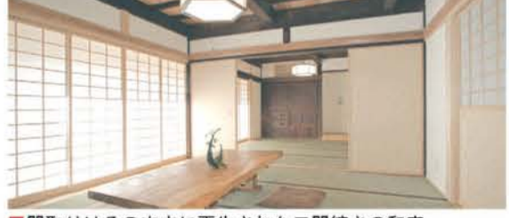
■間取りはそのままに再生された二間続きの和室

・富岡市景観賞 受賞 ・「2010くまの家」設計建設コンクール リフォーム住宅部門 優秀賞