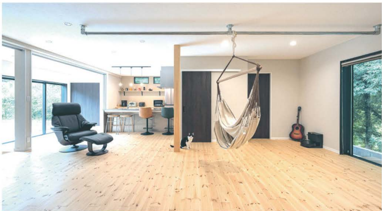
■無垢の床材を使用したリビングは、家族が集って一番長く過ごす場所だから広くて快適に