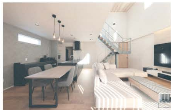
■ グレイッシュで統一された開放的なLDK