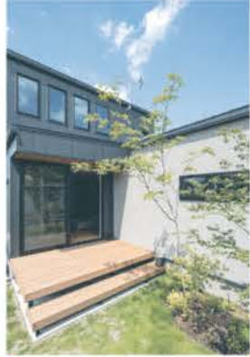
■ プライベートデッキ