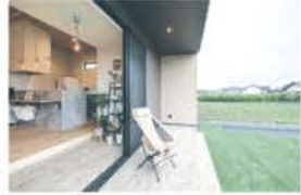
■ 庭とつながる土間リビング