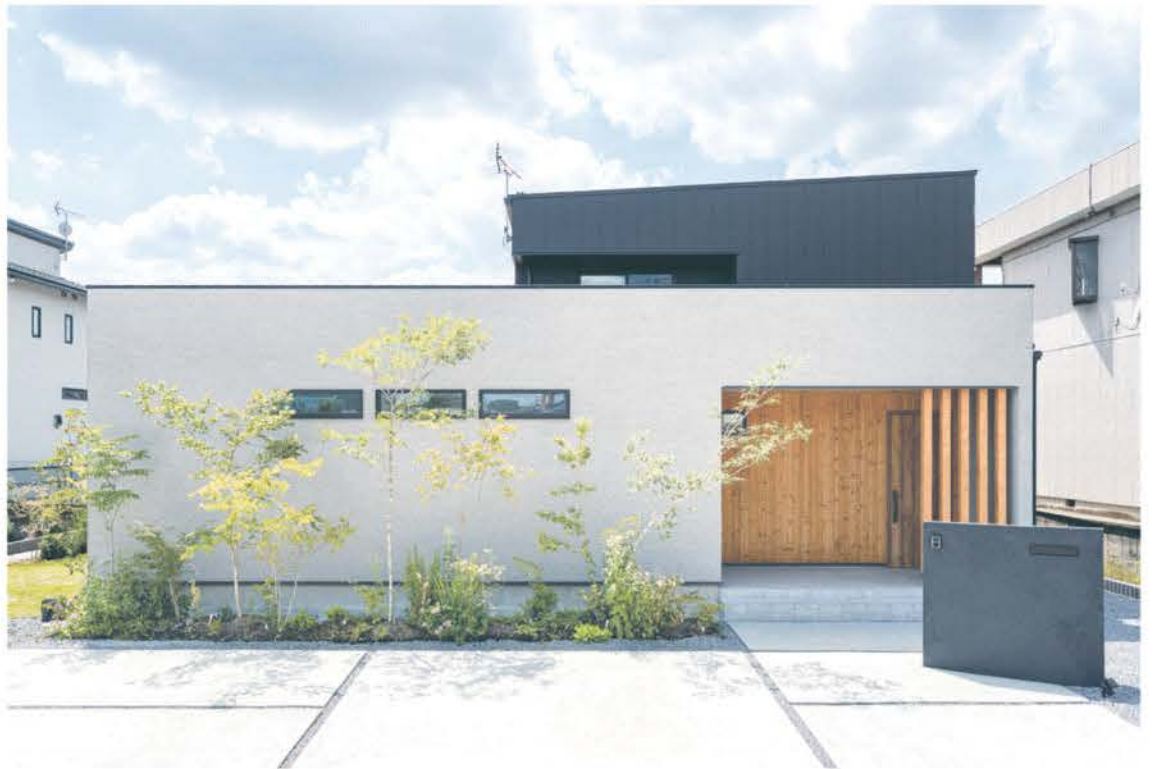
シンプルなBOX型にグレーの塗り壁とブラックのガルバリウムが良く映え、エントランスには唐松を使用するなど異なる素材がバランスよく融合した外観。L型の形状で西側にあるウッドデッキは外からの視線を遮るプライバシーに配慮したデザイン。