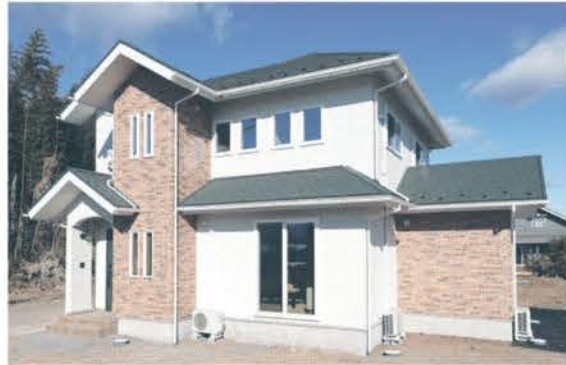
山々を望める眺望の良い場所。自然と調和を考えた外観