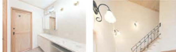
奥行きのある洗面スペース