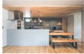
■ オシャレで機能的なキッチン