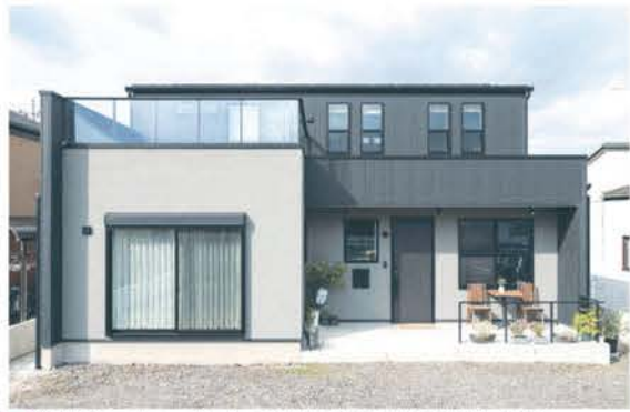
■ 塗り壁をアクセントにして凹凸を強調した個性的な外観