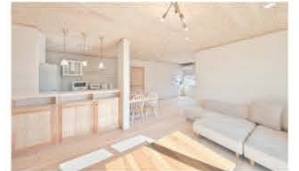
心穏やかに過ごせるくつろぎの空間

営業担当者を置かず、展示場も持たず、さらには見学会も開いていないため、紹介による依頼が多い。その分、より良い木材を届け、より良い家づくりに力を注ぐ。「木を育てた人の心を乗せて、木を使う人に届けたい」という岡田社長の思いからだ。