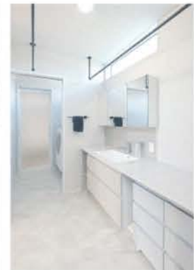
■ 家事ラク動線のランドリー