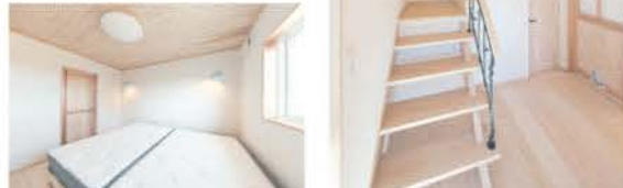
寝室にも自然素材を使用