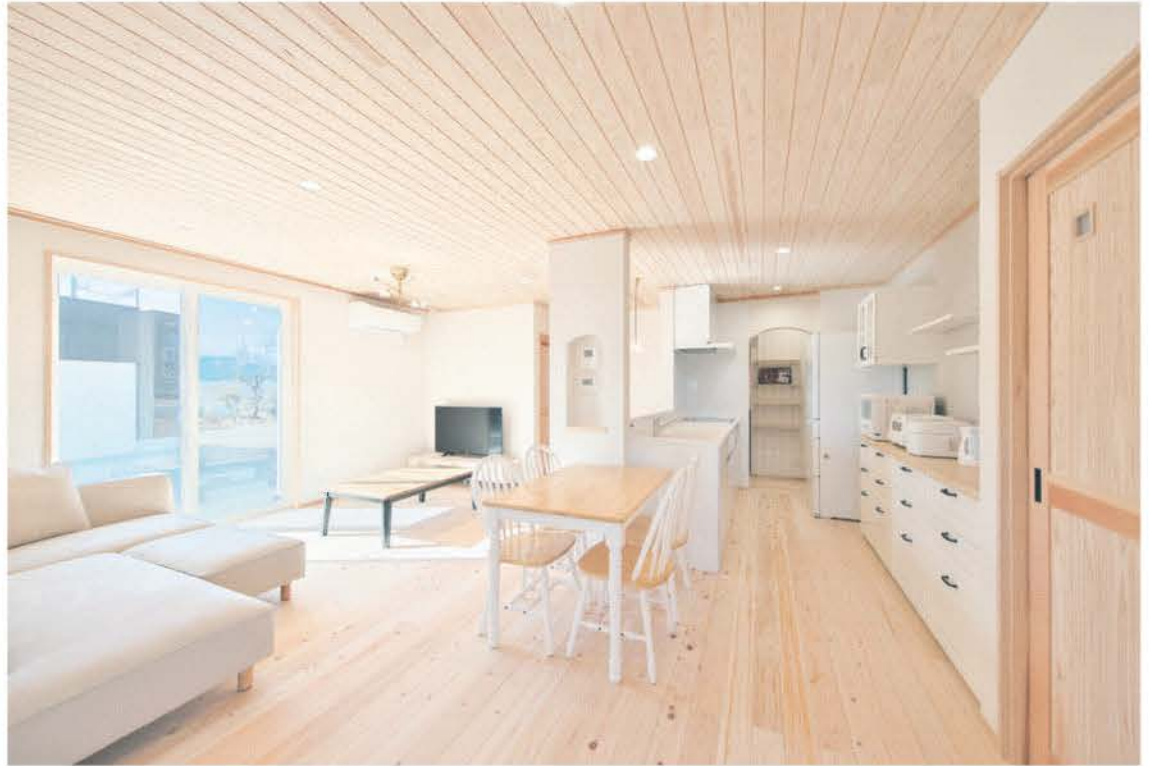
木に対する造詣が深い同社ならではの住まい。天井や床にスギやヒノキといった無垢材をふんだんに使用。木材を適材適所に配置している。木の色合いや木目といった自然素材の特長を最大限に生かすことで、リビングは明るく温かみのある雰囲気になっている。