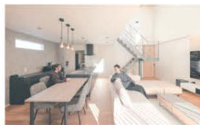
■ 暖かみを感じるリビングで会話も弾む

のない家づくり。その連携が価格を抑えながらの高いデザイン性につながっている。本社の敷地内に建つモデルハウスは、34坪の実邸サイズ。採光にこだわった明るいリビングのほか、スキップフロア+吹き抜けという立体的な設計の和室スペースも見どころ。リアルサイズを体感してみれば、