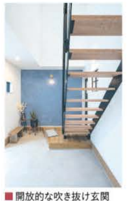
■ 開放的な吹き抜け玄関

安心して長く住まえるよう、全棟長期優良住宅仕様、最長60年保証が付帯され、品質面においてもハイスペックで申し分ない。興味のある人は、毎週土日に開く無料相談会がおすすめ。土地探しから家づくりをじっくり相談できる。まずは気軽に問い合わせみては。