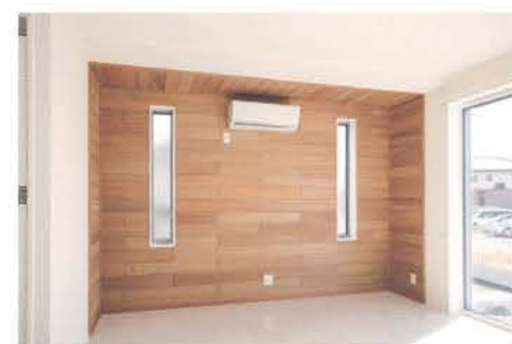
木の温かみが伝わるLDKの壁