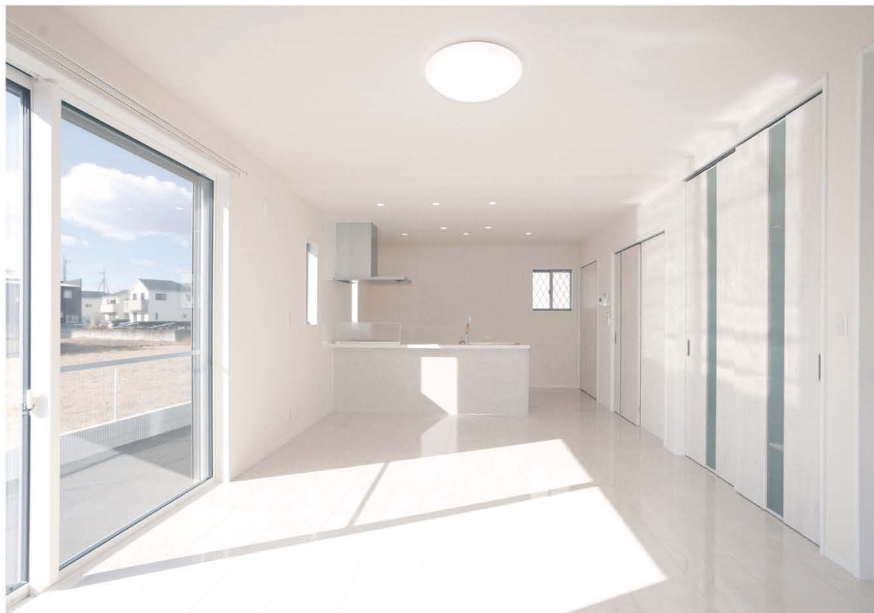
間仕切りのない広々とした開放的なLDK。キッチンからフロア全体を見渡せる