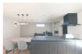
■ 横並びのダイニングキッチン