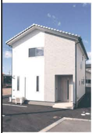
白を基調としたスマートな印象の外観

切妻屋根のシンプルな木造住宅。白を基調とした外観は、グレーの壁材がアクセントになり、スマートな印象を与えている。無駄がなくコンパクトな設計だがしっかりとした造りのため、延床面積が約30坪ながらそれよりもずっと大きく見える。