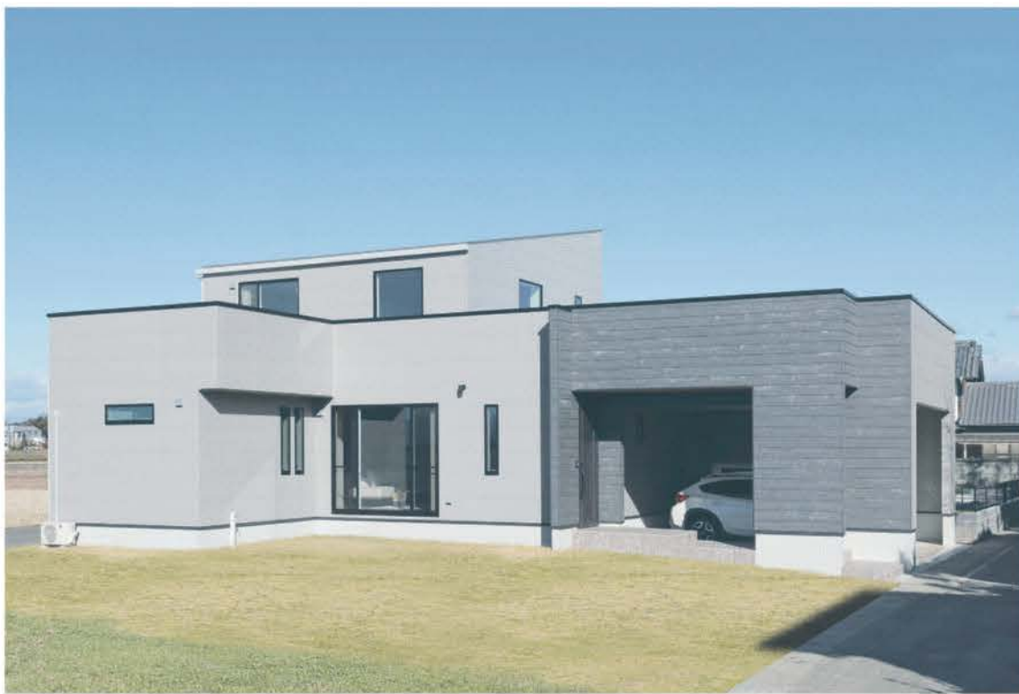
L字形の外観はフラットなサイディングとラップサイディング、一部軒天にレッドラダーの組み合わせ。玄関そばにインナーガレージを併設。