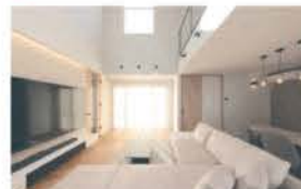
■ 吹抜から光のふりそそぐリビング