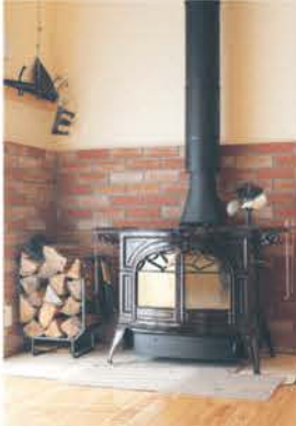
■ 薪ストーブも人気