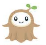
オリジナルマスコット 木らちゃん(木の妖精)

「長期優良住宅」「BELS」「性能評価住宅」などの家づくりに有利な制度の申請業務も代行。一般ユーザーに対しても資金繰りや住宅瑕疵保険などの相談に幅広く応じている。地震に強く、再生可能で地球環境にも優しい木材。木の香りと木材の良さを広め、心地よい住まいのサポートをする同社は、家づくりの強い味方だ。