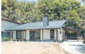
■ ロフトがある家 外観