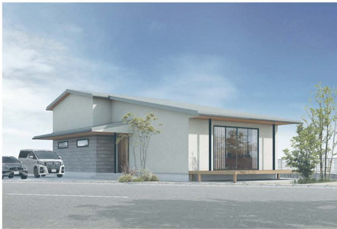
今年6月、高崎市上豊岡町に完成予定の平屋の新モデルハウス「時」。おおらかな屋根と白壁を基調としたシンプルなフォルム。深くせり出した軒は夏の日差しを遮り、冬は太陽のぬくもりを取り込む。自然換気「魔法の空調」を採用したパッシブデザイン住宅。