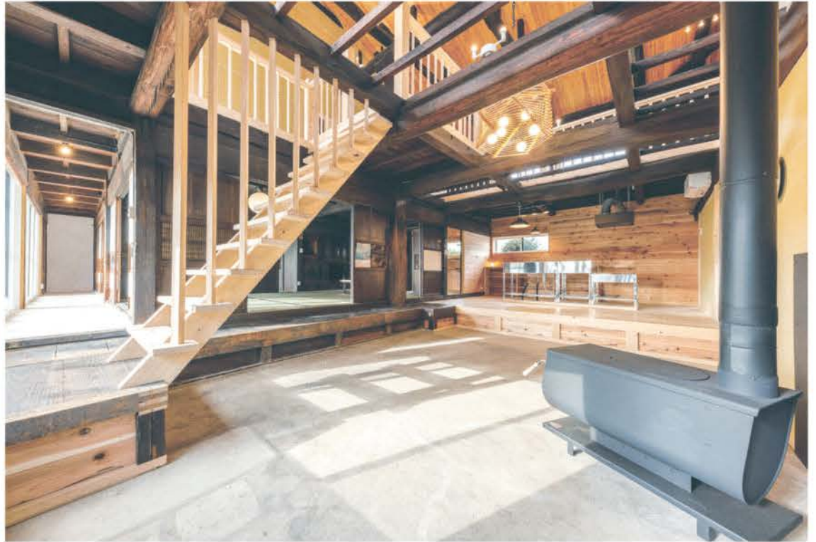
築140年の養蚕農家を改築。使用できる柱や梁、建具は残し、古民家の良さを生かした。広い土間に薪ストーブを設置。オープンな間取りで暖房効率も期待でき、土間が団らんの場としても活躍。水回りは全て改修し、天井、壁に断熱材を施工。構造を補強し耐震性をアップした。