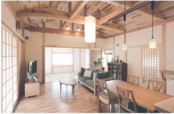
■ 無垢の木の心地よい家 (新築)