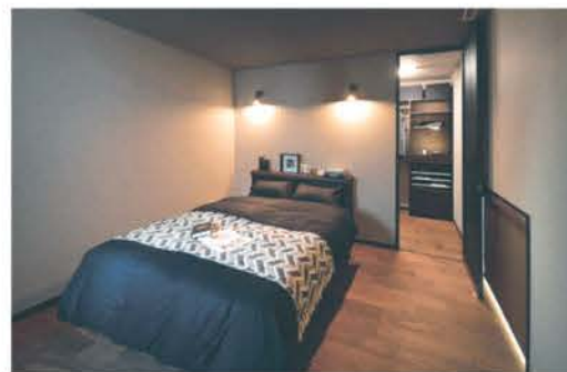
色のトーンを落とした寝室は、控えめな照明で眠りに誘う癒やしの空間

家族が集うLDKは間仕切りのない20畳のワンフロア。濃色のフローリングに、ブラッ