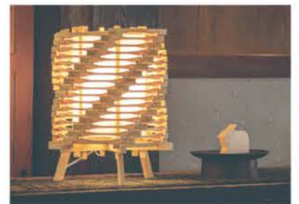
■ オリジナルの木製照明「Uzu(うず)」

吉岡町の展示場では、同社の家づくりを体感することができる。熟練した職人による、繊細な技術を要する造作家具なども一見の価値があり、特許庁から意匠登録された木製照明も展示販売している。