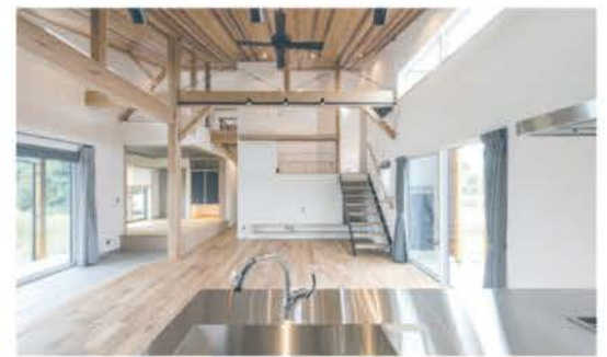
木材をふんだんに使用した省エネ住宅

「長期優良住宅」「BELS」「性能評価住宅」などの家づくりに有利な制度の申請業務も代行。一般ユーザーに対しても資金繰りや住宅瑕疵保険などの相談に幅広く応じている。地震に強く、再生可能で地球環境にも優しい木材。木の香りと木材の良さを広め、心地よい住まいのサポートをする同社は、家づくりの強い味方だ。