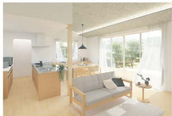
■ 家にいる時間が楽しくなる、開放的で明るい居住空間