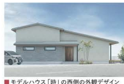
■ モデルハウス「時」の西側の外観デザイン

と提案力が強み。家での時間を楽しむくつろぎの空間、家事負担を軽減する効率のよい動線計画や収納術、家族構成の変化に応じる柔軟な空間配置など、緻密なプランニングは同社の真骨頂。女性スタッフの活躍も頼もしい。6月には待望の平屋の新モデルハウス「時」がオープン予定だ。