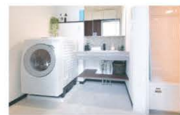
コンパクトにまとまった清潔感のある洗面脱衣室と浴室

チンから洗面脱衣室、浴室、トイレまで、中庭に沿って直線上に配置された家事動線は、コンパクトでスムーズ。寝室に併設したアパレル店のようなウォークインクローゼットも見どころだ。このモデルハウスは宿泊体験も