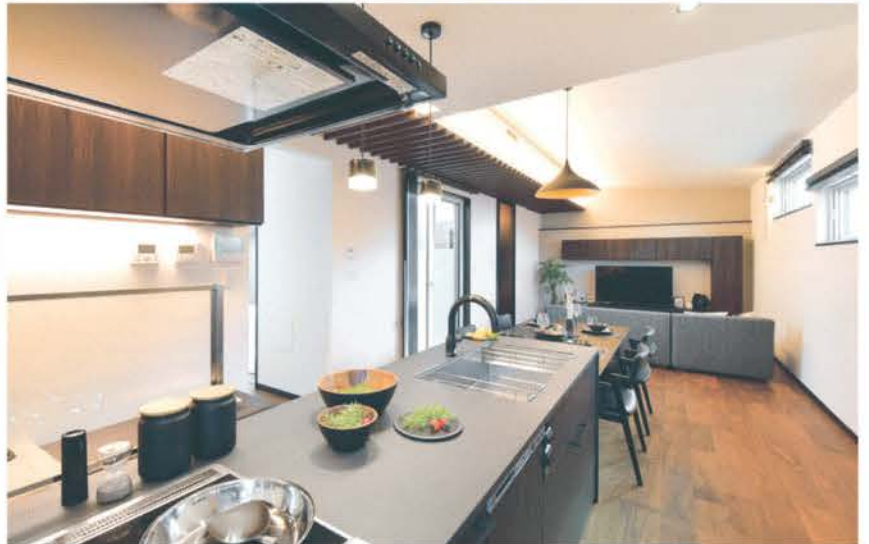
ダークカラーを基調とした縦長レイアウトのLDKは、どこにいても中庭が視界に入る。キッチン対面にはコミュニケーションを取りやすいベンチ収納が備わる