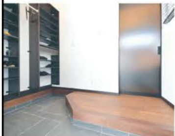
中庭から光が入るシューズクローク付きの玄関ホール

伊勢崎市西小保方町にヤマト住建の新しいモデルハウスが誕生した。おもなターゲット層は子育て世代。ライフスタイルにフィットする延床面積28坪というリアルサイズの平屋住宅だ。外観は直線的なフォルムに黒×グレーのツートンカラーがスタイリッシュな印象。