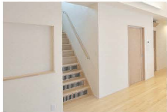
■ 床下で暖められた新鮮な空気を床や階段のガラリから室内に供給