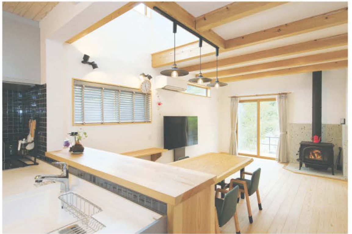
キッチンに立てばフロア全体が見渡せる間仕切りのないゆったりとしたリビング空間。室内の空気感が心地よく、木の香りと漆喰の塗り壁の清涼感に包まれた薪ストーブのある住まい。自然素材のぬくもりあふれる暮らしを提案している。