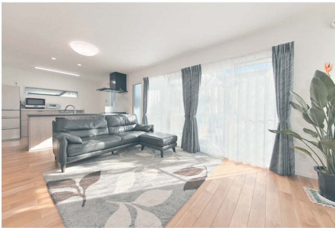
スーパーウォール工法で建てたZEH基準を上回る高断熱・高気密の平屋の家。明るく開放感のあるリビング空間。ご夫妻がセカンドライフを過ごすには広々とした1LDKはちょうどいいサイズ。