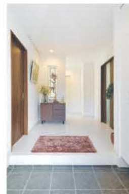
白を基調とした明るく奥行きのある玄関ホール

パネル12.45kWと大容量の蓄電池を導入し、最新設備機器も備え、EV車やIoT家電を連動させたスマートハウスとしての広がりも期待できる。家族との暮らしを育み、「代々続いたこの場所にずっと住み継いでいけたら」とご夫妻は期待を寄せた。