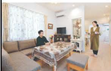
仕切り壁を効果的に用い空間を独立させたリビングは、応接間のように来客を歓迎する

奥さまの先祖が住み続け、かつては養蚕農家として機能し、空き家となった築120年の祖父母の家。「自然を感じながらのんびり暮らしたい」と願うご夫妻は、この歴史ある建物を生かそうとリフォームを検討したが、あまりにも課題点が多