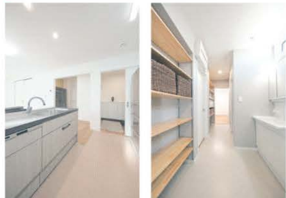
■ 玄関とつながるキッチン