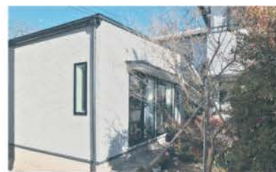
■ 平屋の相談件数は毎年増えている

事務所兼用のモデルルームは、北欧デザインを思わせるカラーが印象的で、ターコイズブルーの壁、トーンをそろえた色違いのカーテン、6種類の無垢板を張った床など、素材の比較も体験できて便利。この空間を利用した家づくり勉強会を無料で毎月開催している。