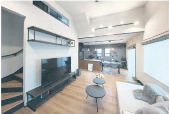
■天井が高く明るく開放感のあるリビング空間