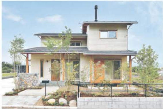
■ 深い軒と柱の木部が落ち着いたあるオフホワイトの外壁に調和する