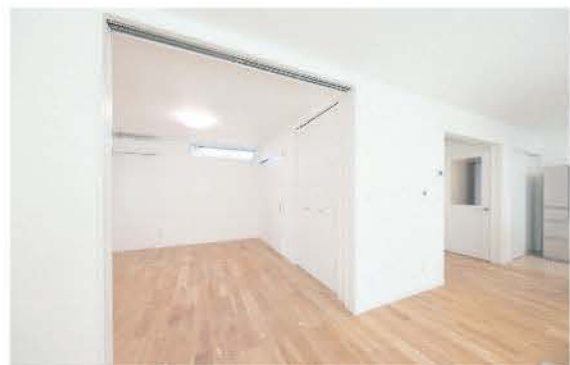
■ 間取り動線のいいリビング空間