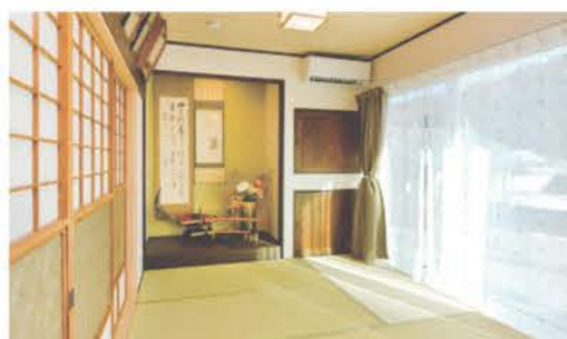
南面に配置した明るい9畳の和室には懐かしい旧家の建具を再利用している

のいい住まい。「窓から四季折々の景色が楽しめる」と話す奥さま。大空間のLDKに設けた仕切り壁は、壁に埋めたスタンドグラスの効果でほどよく気配を感じられる。インテリアは奥さまがセレクト。旧家で使用していたレトロな家具や小物が調和している。「電力を気にしなくていい」とほほ笑むご主人。太陽光