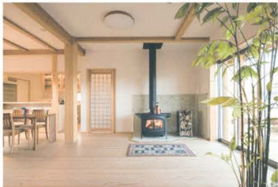
■ モデルハウスでは薪ストーブの「火のある豊かな暮らし」を体感できる