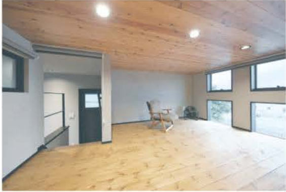
■無垢の杉板を張った低天井のフリースペース