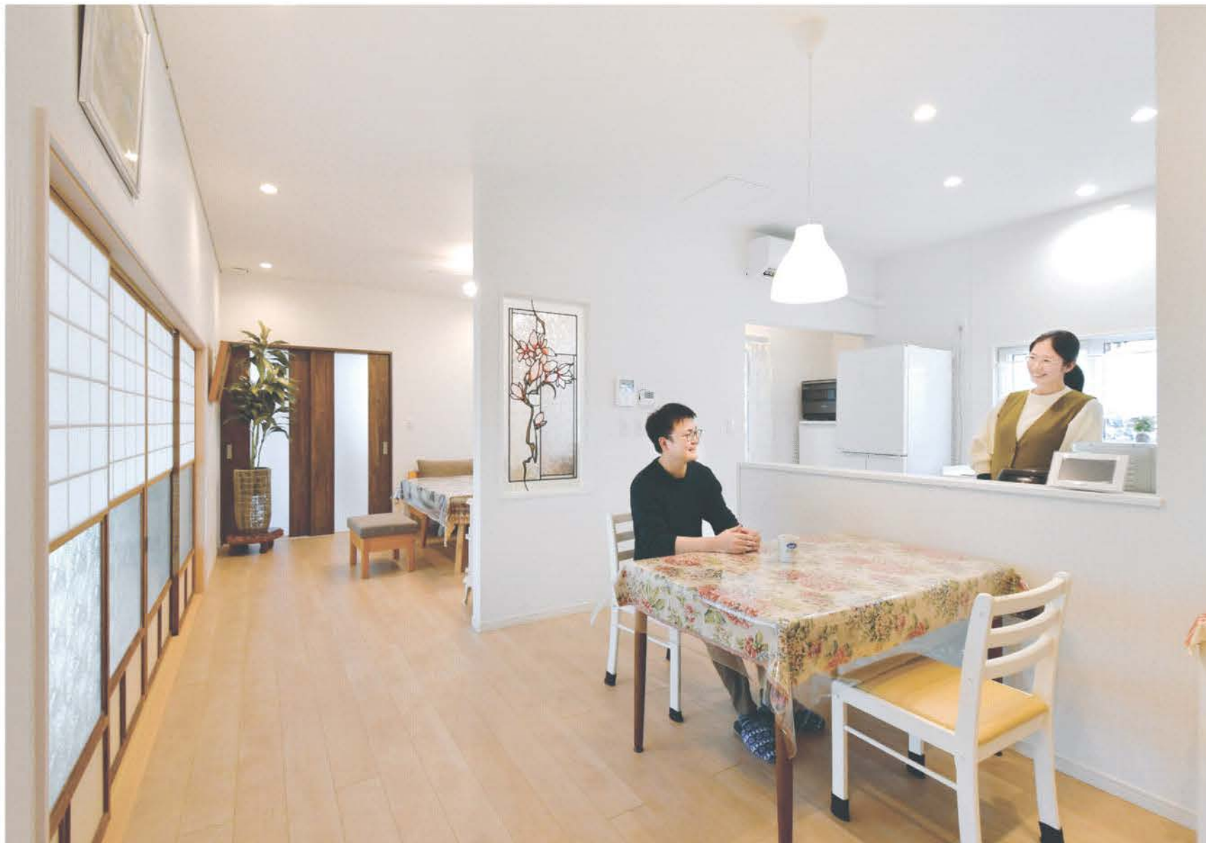
カウンター越しに会話が弾むご夫妻。緩やかに大空間につながる明るく開放的なダイニングキッチン