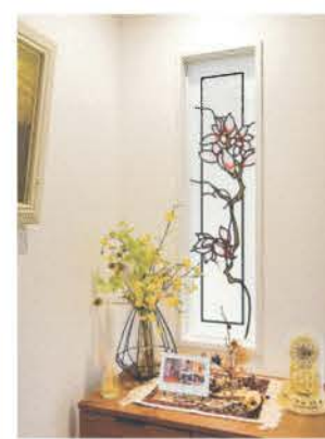
モクレンの花をモチーフにしたスタンドグラスが光を透過しながら空間を彩る

のいい住まい。「窓から四季折々の景色が楽しめる」と話す奥さま。大空間のLDKに設けた仕切り壁は、壁に埋めたスタンドグラスの効果でほどよく気配を感じられる。インテリアは奥さまがセレクト。旧家で使用していたレトロな家具や小物が調和している。「電力を気にしなくていい」とほほ笑むご主人。太陽光