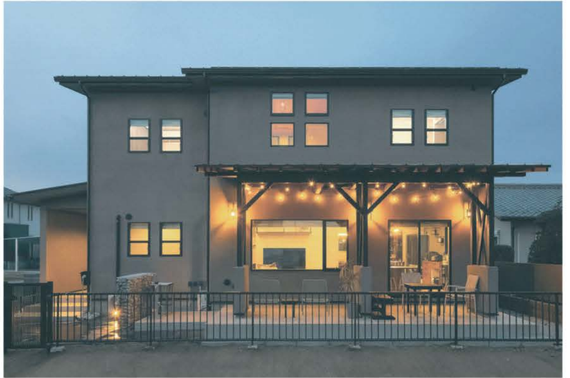
閑静な住宅街にたたずむ2階建ての邸宅に、暖かな明かりがとる夕暮れ時の様子。モデルハウスを彷彿とさせる4つ並んだ窓と、軒の深いテラスを有する外観デザインが特徴的。内装は木部にグレーの濃淡と黒でコーディネートしたモダンな住まい。