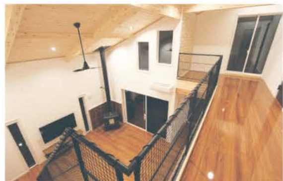
■ ワンフロアで家族の気配を感じる子育て世代に使いやすい間取り