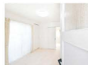
玄関から望むLDK。モザイク柄のガラス窓がかわいらしい