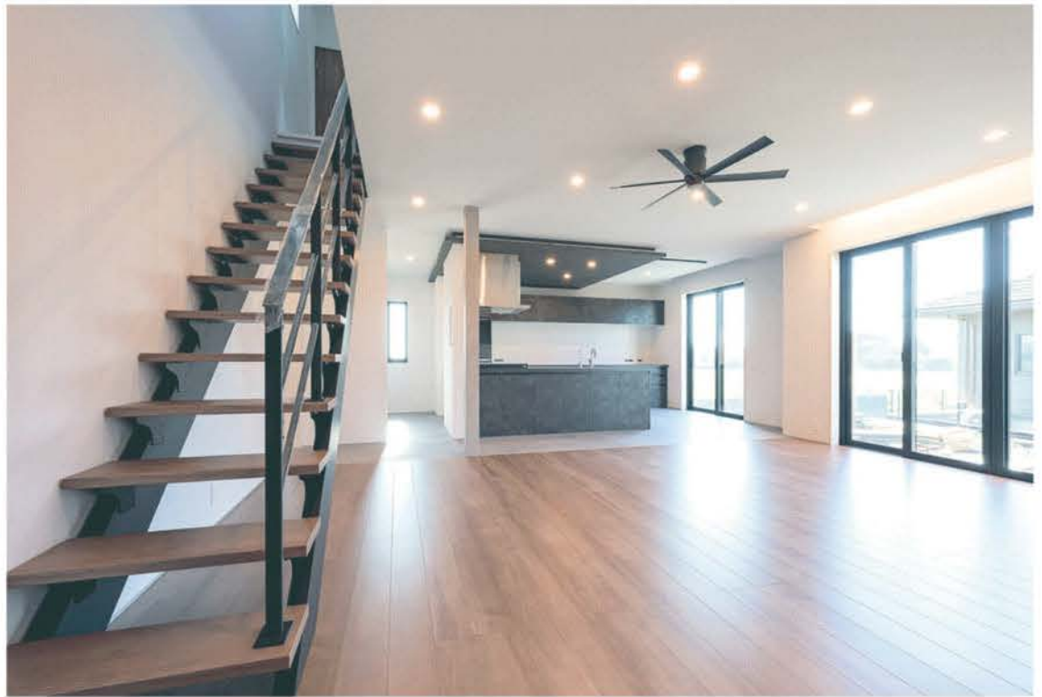
家族がいつも顔を合わす開放的なLDKと階段