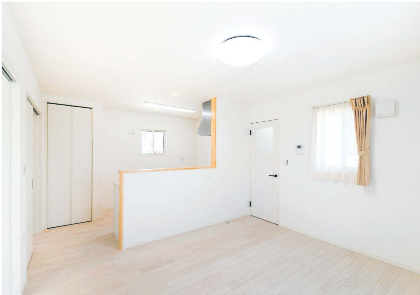
白を基調としたLDK。温もりのある木目とドアノブだけに使った黒がアクセントとして効いている。寝室や水回りを仕切る引き戸は吊り下げ式。レールがないので空間が一層広く感じる