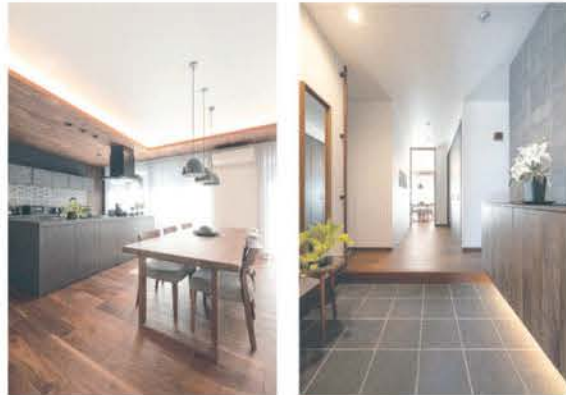
■ モダンなキッチンとダイニング ■ ゆとりある広さの玄関ホール