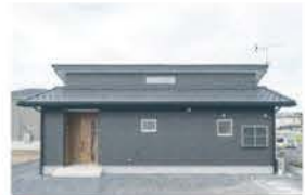
■ コンパクトな自由設計の家