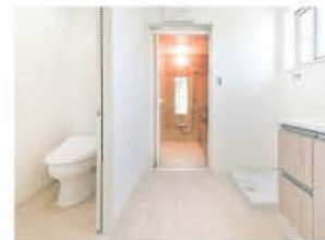
寝室やLDKから近い位置にトイレを配置。奥はバスルーム

当初オーバーするのが常、と思っていた価格は見積もり通りにピッタリと納まった。「大満足の新居。明日からの暮らしが楽しみです」と声を弾ませた。