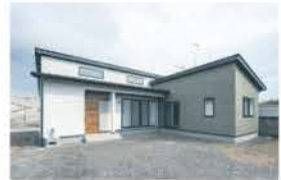
■ 敷地を生かした家づくり