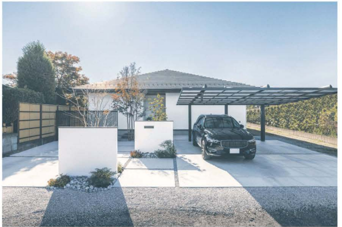
事務所の近くに建築した平屋モデルハウス。ウォルナットカラーで統一した木部が重厚な印象の室内は、大人の落ち着きを感じさせるぜいたくな空間。各所に設けた収納やシンプルな家事動線も魅力だ。見学は予約にて随時受付。