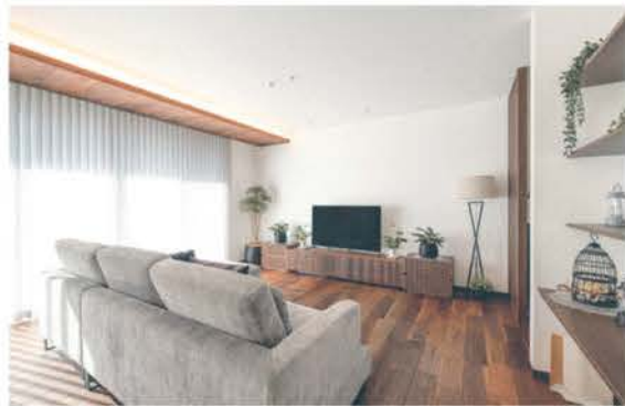
■ 明るく穏やかな日差しが入るワンフロアのLDK