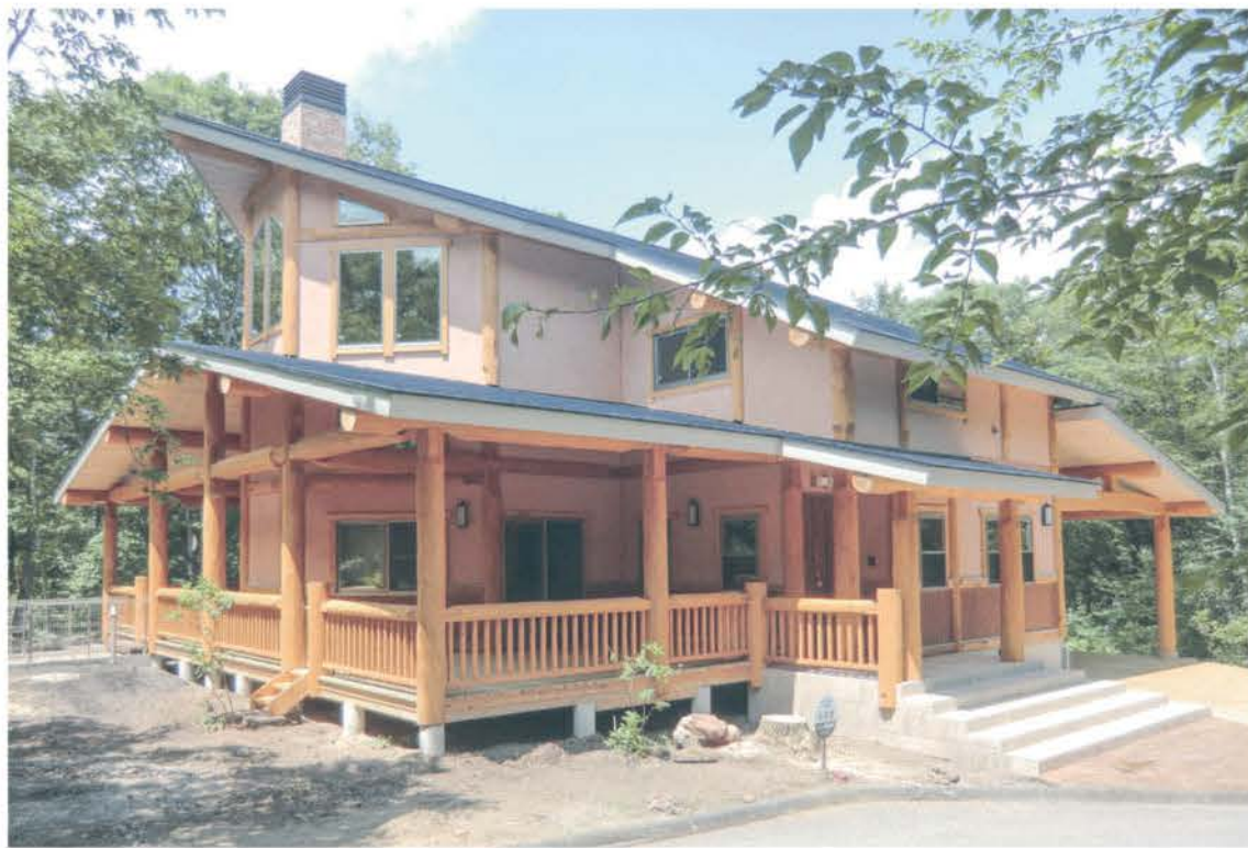
天然木をふんだんに使用したP&B工法の家。広々としたウッドデッキのある外観が、緑豊かな周辺環境に調和している。室内は壁や天井のほか、あらゆる家具を無垢材で仕上げ、施主の理想とする「木のぬくもりを感じる暮らし」を実現した。