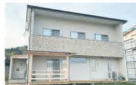
■ 規格型のデザイン住宅