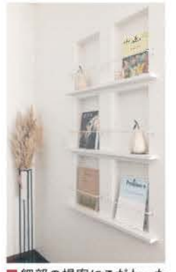
■ 細部の提案にこだわったマガジンニッチ

が多いのも納得だ。設計も自在で、現場でも柔軟に融通を利かせ、施工支給も受け入れる。インテリアアドバイザーによる細部の提案も心強い。近年はリフォームにも力を入れ、水回りの交換から大規模な工事まで請け負う。「リフォームも見積額で比べてほしい」と呼びかける。