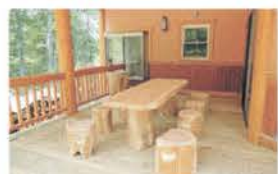
■ 広々としたウッドデッキ