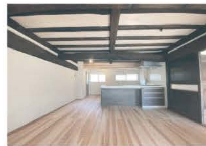
■ 古民家リノベーションで民泊施設に再生

スに代表されるP&B工法(ポスト&ビーム工法)も得意とする。寒冷地仕様の施工に強い点も同社ならではの。水回りリフォームから大規模なスケルトン改修まで守備範囲は広く、近年では地の利を生かし、軽井沢での別荘のリノベーション依頼も多いそうだ。