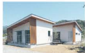
■ コの字レイアウトの平屋