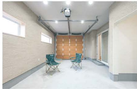
■ 車が好きな人にインナーガレージ