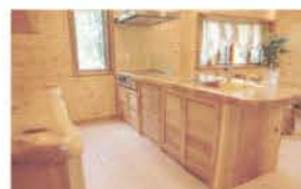
■ 無垢で仕上げた造作キッチン