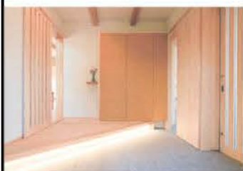
芦野石敷きの玄関土間。建具の右横はギャラリーへつながる

「今とこれからの考えた心地よさ」がテーマの小林建設の住宅展示場「ギャラリー hinosumika」。近くの山で育った木材の活用、気候風土や周囲との調和、自然との共生など、こだわりのすべてを「ギャラリー」のように見せられたら、とつくられた。