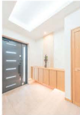
■ 広々とした玄関ホール