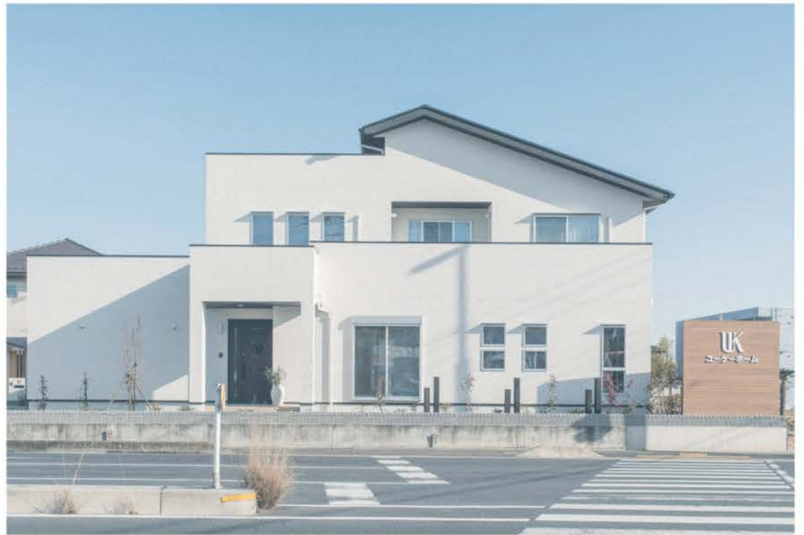
長期優良住宅仕様で、2世帯を想定した間取りの「小八木モデルハウス」。家事動線や収納スペース、バリアフリーなど見どころが盛りだくさん。幹線道路沿いにありながら室内はとても静か。優れた遮音・断熱性能も体感できる。