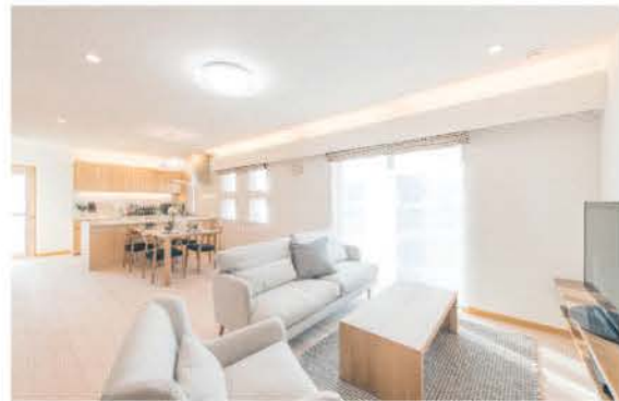
■ 落ち着いた色合いで、明るく開放的なLDK