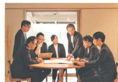
最良のプランを練り上げる自社設計士。社内コンペで設計力に磨きかける

同社の家づくりに欠かせないのが、パッシブデザイン。光や風など自然の力を活用し、1年を通して快適な家をつくる考え方をさす。「寒い、暑い、暗い、風が通らない」というストレスがなく、光熱費の負担も軽減される。一方、最適な冷暖房や給湯設備を用いて、快適・安全・省エネ性を高めるアプローチがアクティブデザイン。この2つのデザインの融合が「1年中過ごしやすい住まい」をつくる上で必須として、実践している。