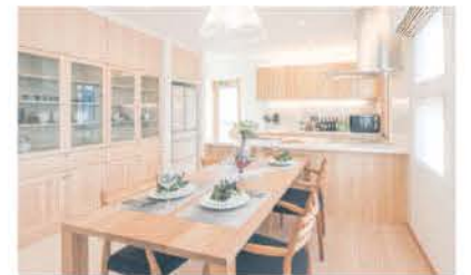
■ 使いやすくレイアウトされたダイニング・キッチン

なっている。これまでの断熱性能に加え、新たな3つの対策にも取り組む。家全体の給排気で冷暖房コストを抑える「熱交気調システム」、透湿・防水性に高い遮熱効果をプラスした「遮熱透湿防水シート」、屋根からの熱を抑え雨水もガードする「遮熱アスファルトルーフィング」で快適な生活を実現する。