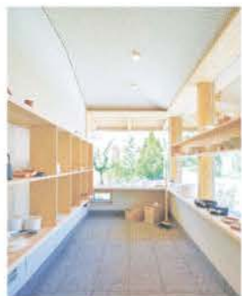
入口右手にあるギャラリーも特徴の一つ

吹き抜けの開放的なリビング、庭と室内をつなぐヒノキのデッキや大開口部、2階のオープンスペースなど、居心地のよい空間を各所に配置。深い軒や光と風の動線を考えた設計など、同社が得意なパッシブデザインも取り入れている。