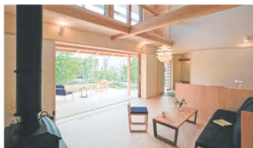
リビングからデッキ、庭へとつながる設計。大開口部があることで、自然や四季を感じた暮らしが可能に

同社は創業1921年。社員に多くの一級建築士を抱え、アーキテクト(設計者)とビルダー(施工者)の両方を備えた工務店だ。最も特徴的なのが、自社設計士たちがチームで「社内コンペ」を行い、磨き抜かれたプランをお客さまへ提案すること。設計士集団が生み出す同社ブランドの住まい「陽の栖」はこうしてつくられている。