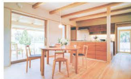
採光が確保された開放的なダイニング。サクラ材を生かしたキッチンは大工の手仕事