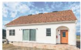
■ 平屋プラン「タイニーハウス」