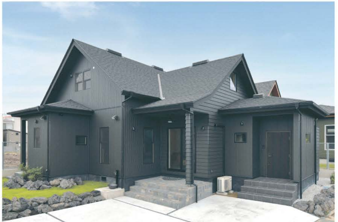
高崎市新保町のモデルハウス「休日の似合う家 ジャンボリーブラックエディション」。オールブラックの外観や溶岩を使用したロックガーデンが印象的。