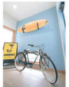
■ 趣味にも使える収納

SNSも積極的に展開し、新商品の紹介やオープンハウスの様子を配信する。2020年に高崎市新保町に「休日の似合う家 ジャンボリーハウス」、翌年には隣接地に「休日の似合う家 ジャンボリーブラックエディション」のモデルハウスをオープン。待望の平屋プラン「タイニーハウス」も誕生した。夫婦2人だけや高齢者向けとして、コンパクトかつおしゃれでかわいいと好評だ。