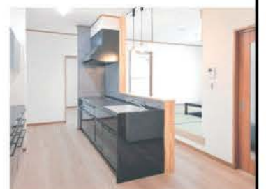
締め色に黒を用いたシックなキッチン。回遊できる間取りで居室にも水回りにもアクセスしやすい

リビングと向かい合わせのキッチンは独立型。後ろは水回りをまとめた。回遊できる動線で、家事が楽になり、暮らしやすさもアップする。