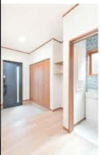
たっぷりの収納で玄関周りはスッキリ

「すみかくらぶでナベホームを知ったことが転機」と満面の笑みを浮かべて口をそろえるO様ご夫妻。築45年の家のリフォームを他社に依頼したところ、見積もりは1,600万円。そんな時、本紙で60代のご夫妻が建てた同社の住まいを目にした。