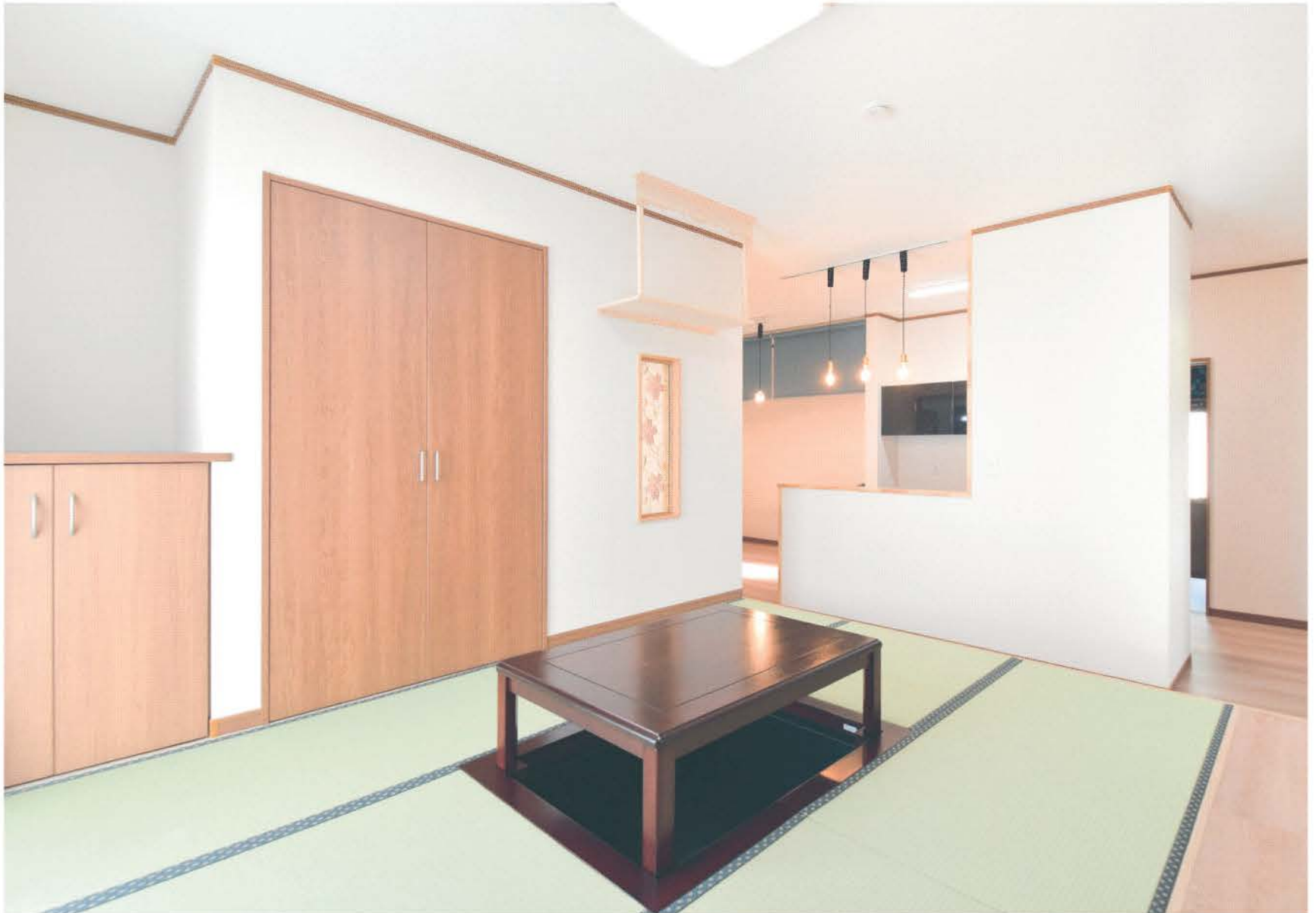
一段高くなっているリビングは、ごろりと寝転べる畳敷き。端に腰かけ、キッチンを挟んでおしゃべりに花を咲かせるのも楽しそう。テーブルの下は掘りのように座れて楽

■建築面積/85.29㎡(25.80坪) ■延床面積/82.81㎡(25.05坪) ■建築工法/ツーバイフォー工法 ■完成日/2024年9月 ■施工事例をもっと見る▶