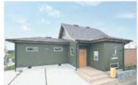
■ モデルハウス「ジャンボリーハウス」