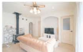
■ 内装のデザイン性が目を引く