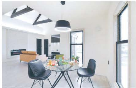
■ モノトーンのダイニング。左奥にはリビングが広がる