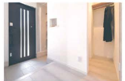
便利な土間収納により玄関周りはいつもスッキリ快適