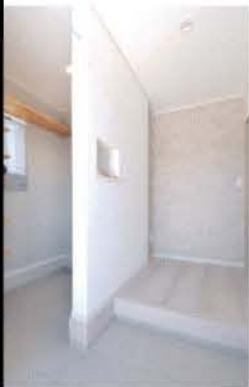
使い勝手の良い2way玄関

ホワイトとベージュの外壁に差し色の黒、太陽光パネルは目立たないように設置するなど、随所にさりげないこだわりが詰まっている。