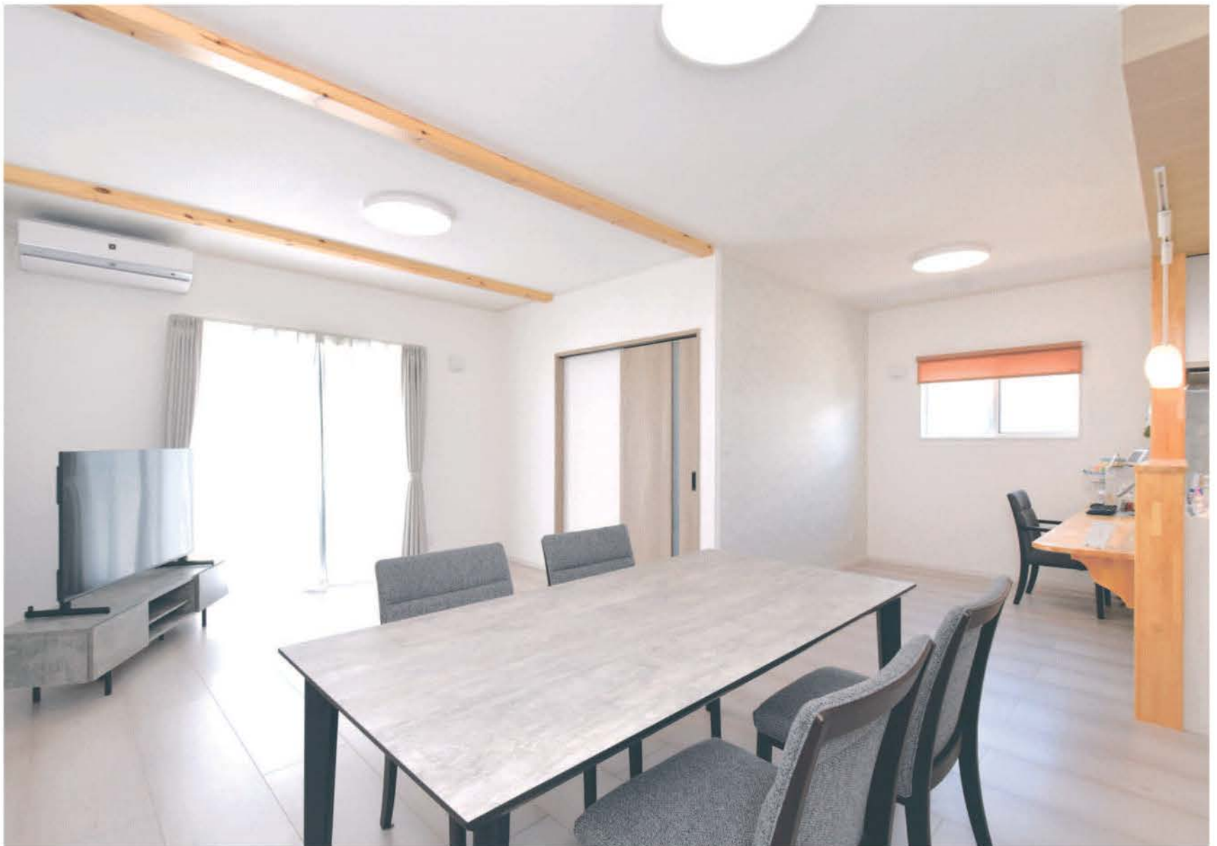
LDKは見せ梁で天井が高く開放感がある。広い空間を活かして、奥さまのワークスペースも配置