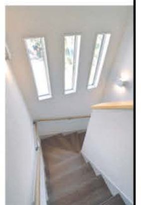
北側にある階段の三連窓からは、やわらかな光が降り注ぐ

大竹住建は利根沼田を中心に地域密着の家づくりを手掛ける。高性能断熱材「アクアフォーム」による高気密・高断熱な住宅に性能の高い省エネ設備が標準装備され、光熱費を抑えて暑い夏も厳しい冬も快適に過ごせる。さらに床下に断熱材を追加したことで真冬も床暖房のような暖かさを感じることができる。