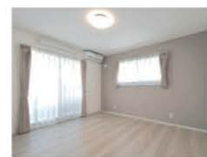
アクセントクロスでリラックスできる寝室。各部屋もクロス選びにこだわった

建てた後の暮らしを考え、暮らすほどに良さが分かるのが、大竹住建が提案する人とお財布にやさしい『エコ住宅』。ご夫妻は