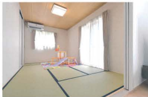
リビングの続き間に和室をレイアウト。開口部が広く一体感があり、キッチンからも見渡せる

家事動線にこだわり、水回りを集約したほか、パントリーや階段下など収納を充実。脱衣室と洗面室は朝の混雑を緩和させるために独立させた。2階には寝室と子ども部屋2室、納戸のほか、ご主人念願の書斎も設けた。