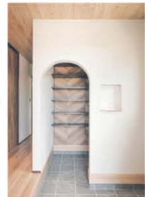
■ 玄関土間にアール壁の収納