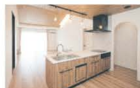
■ キッチン横に食品庫を配置