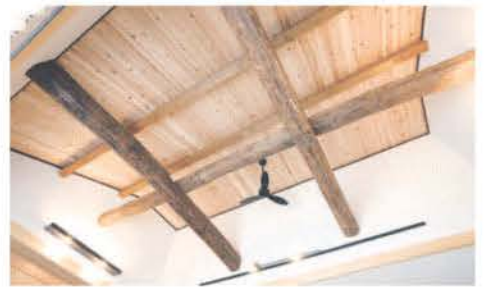
杉板を張り、古材の梁を縦横に渡した迫力のある勾配天井