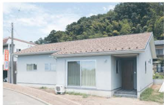
■ グレーの塗り壁と洋風の切妻屋根の平屋は、カフェ風がテーマ