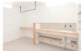
■ ランドリールームは造作が充実