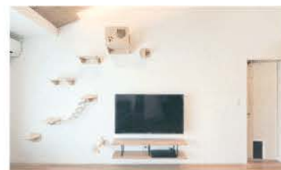
■ 愛猫用の壁面のステップや扉の通路を用意

おいても柔軟に応じ、施主にとって最良のコストバランスへ導く。良心的なスタンスがさまざまな年齢層に支持されている。完成後のメンテナンスに加え、水回りなどのリフォームから大規模リノベーション、土地探しなど、住まいに関する悩み事や相談にも「身近な存在」として気軽に応じている。