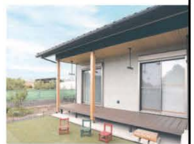
板張りの軒天井が深くせり出したデッキは、洗濯物の外干しに便利

口部には断熱や防音に効果を発揮する二重サッシを採用し、換気システムには第1種換気を導入した。断熱・気密性能を高めた室内は、魔法瓶のようにすっぽりと覆われ、酷暑の続く今夏でも「エアコン1台だけで寝室まで涼しい」と話す。