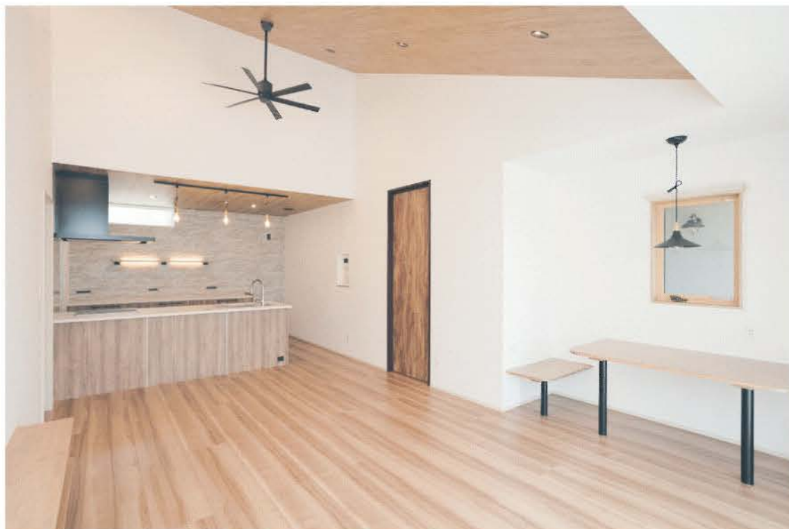
板張りの勾配天井が開放的なワンフロアのLDK。愛猫と暮らす施主はペットが滑りにくい床を採用した。奥行きを持たせたコーナーに小窓を設け、テーブルとベンチを造作し、ヌックとして活用。デザイン性のある居心地のいい空間が生まれた。