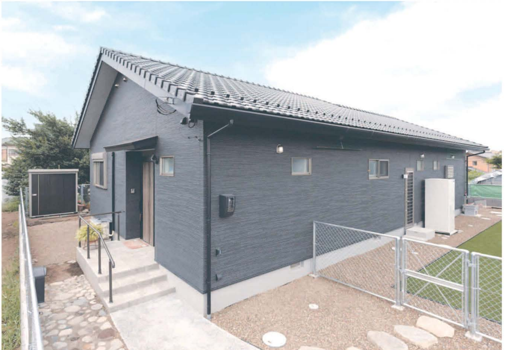
木質感にあふれた室内とは大きく印象の異なる、黒を基調としたモダンな外観。フェンスで囲い、人工芝を敷き詰めた中庭を受犬が走り回る。