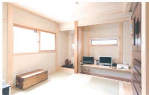
端正な和室。畳の縁に座って足を落とせるカウンターは、ご主人の書斎として活用

口部には断熱や防音に効果を発揮する二重サッシを採用し、換気システムには第1種換気を導入した。断熱・気密性能を高めた室内は、魔法瓶のようにすっぽりと覆われ、酷暑の続く今夏でも「エアコン1台だけで寝室まで涼しい」と話す。