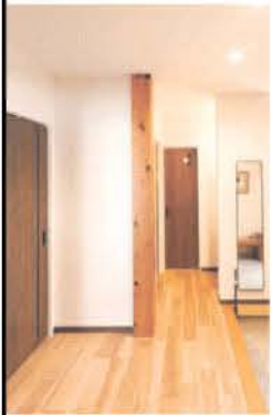
玄関ホールは骨太な日光杉の大黒柱が訪れる者を迎える

北側アプローチのS邸は、黒い外壁に切妻屋根を乗せたシンプルなフォルムの平屋。南面に回り込むと、コンクリート調のグレーの外壁とウッディーなデッキを覆うように深い軒が掛かる。