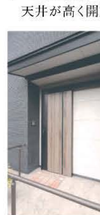
引き戸を採用した玄関ポーチはコンクリート調の壁がアクセント

天井が高く開放感のあるリビング空間で、ご夫妻は木のぬくもりを感じながら愛犬と一緒にのんびりとくつろぐ。日が暮れて明かりがともると、立体的な梁が壁や天井に陰影を落とす。「天井を見上げると山小屋にいるかのよう」と、日常の中にある非日常感を楽しみながら、ご夫妻は平穏な日々を過ごしている。