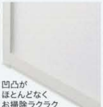
凹凸が ほとんどなく お掃除ラクラク うつくしドア