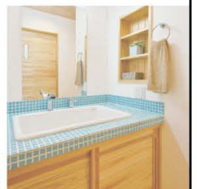
ブルーのタイルを張った造作洗面台を便利な動線上に配置

わせに持参したそう。設計士がプランに反映したのは円を描ける動線。通り抜けられるファミリークロークは奥さまのお気に入りだ。吹き抜けから光が降り注ぐ、明るく開放感あふれるワンフロアのLDK。併