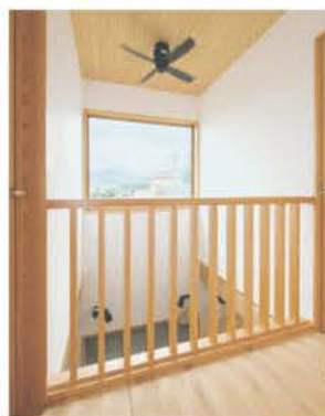
吹き抜けのピクチャーウィンドーが光と屋外の景色を取り込む

りを計画した。「山の見える場所がいい」。アウトドアが好きなご主人はロケーションを重視し、自らの足で3年がかりで土地を探した。ドローンを飛ばして景観を確認するほどの徹底ぶりだ。その上でご夫妻が希望したのは、将来的に1階だけで暮らせる2階建て。家族が集うリビング空間を伸びやかに、そして2階の子ども部屋2室はコンパクトに、景観を優先したご主人の書斎も2階に設けた。階段を上ると、吹き抜けの大きなFIX窓に目線が抜け、里山の景色が1枚の絵のように視界に入る。書斎の西窓からは赤城山の雄大な景色がいつでも楽しめる。