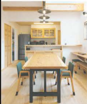
漆喰の塗り壁と無垢の木が調和するダイニング・キッチン

赤城山を望む眺望のいい高台に立つA邸。ウッドデッキを覆うように深くせり出した軒と、それを支える桁