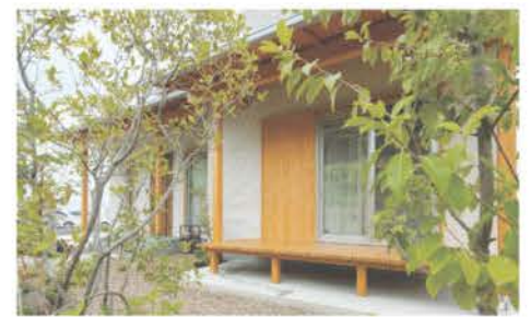
木質感あふれる和モダンの外観を植栽が引き立てる