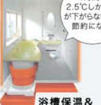
浴槽保温& 浴室保温