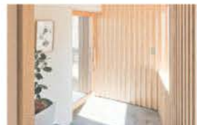
■ 自然採光で明るい玄関ホール