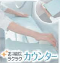
お掃除ラクラク カウンター