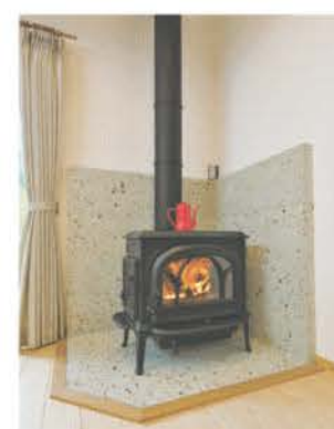
「揺らめく炎を見ながらお酒を楽しみたい」とご主人

所があり、家族が自由に過ごせる」と話すご主人。リビングのコーナーには念願の薪ストーブが備わり、冬にはピザを焼いて家族で楽しんだ。火のある豊かな暮らしを満喫している。