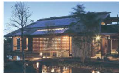
■ 池や植栽などのある庭と建物が溶け合う景観

の環境に溶け込むたたずまい、そして色あせないデザイン。庭と建物が一体化した「庭屋一如」の世界に磨きがかかり、野鳥も訪れる。建ててから歳月を重ねることによって本当の価値が現れる住まい。その意味でコバケンLaBOはリアルな展示場であり、家づくりのラボでもある。