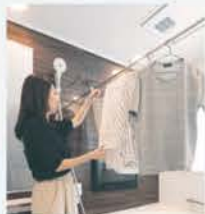
浴室換気暖房乾燥機