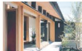
■ ウチとソトがつながる開口部