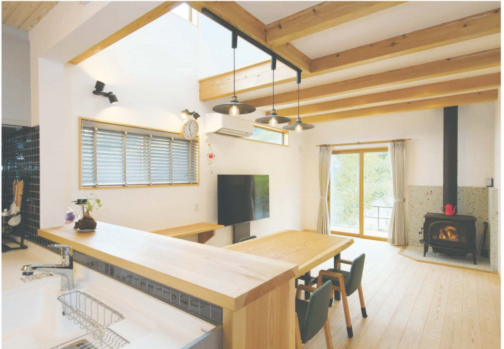
間仕切りのないゆったりとしたリビング空間。キッチンに立てばフロア全体が見渡せる