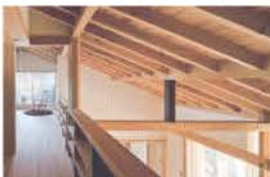
■ 吹き抜け奥に丸窓のある書斎