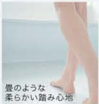
畳のような 柔らかい踏み心地 ほっかり床(TOTO)