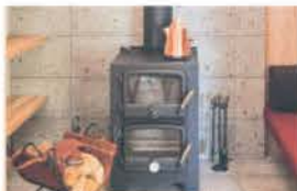
■ 薪ストーブコーナーを北側に