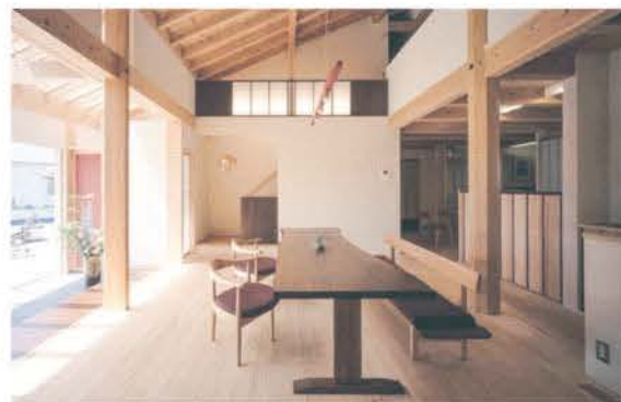
■ 地域材と自然素材を巧みに生かし、心地よい空間が広がる