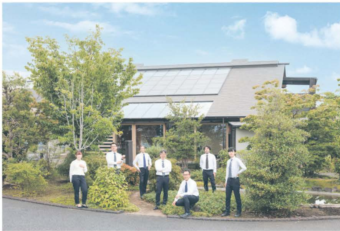
11周年を迎えたコバケンLaBO。周囲になじみながら色あせないデザイン。歳月に磨かれ、真に価値のある住まいとは何かを物語る。一年を通じて快適に過ごせる小林建設ならではの工夫が随所に。木の家とパッシブデザインの調和した上質な住み心地を体験できる。