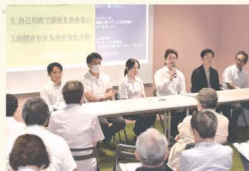
空き家にまつわる参加者の質問に答える解決隊メンバー

セミナーでは、相談窓口を通じて空き家問題が解決した事例を紹介した。相談から約1カ月で「スピード売却」した物件や、築100年以上の古民家が贈与という形で