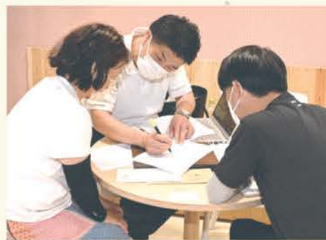
希望者には解決隊による個別相談が行われた

事前に希望した18人を対象に、解決隊の6社による個別相談会も開催した。参加者は各ブースに分かれて相談し、所有する空き家の処理や手放す際の事前準備について具体的な助言を受けた。